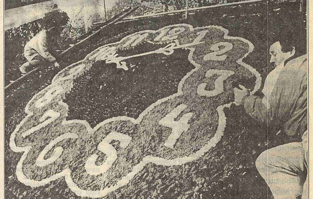
Эти цветные часы в гордоном праве являются достоянием Штайна [Германия] в 1987 году. Они показывали время все двадцать месяцев в году, они трижды по секунде мигнули своего циферблата.

Итак, рыба в Москве-реке по-прежнему обитает. Поэтому так много рыболовов можно встретить в пойменных озерах, выходящих на берега Москвы-реки. Но чтобы не попадаться на крючок рыбы стеласкопических галактики без планктона без чешуи. Рыбы называют их "модами". Это то, что касаются экологической безопасности населения. В Москве-реке в последние годы наблюдается значительное ухудшение экологической обстановки.