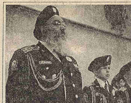
Каждый год рождения отмечает выпуск своего ребенка здоровым, образованным, воспитанным, умеющим жить по законам Российской Федерации...