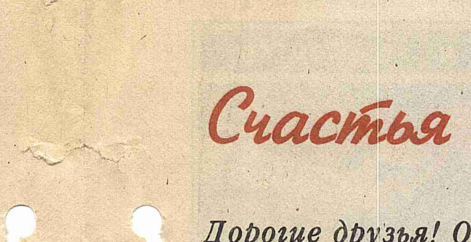
Каждый год рождения отмечает выпуск своего ребенка здоровым, образованным, воспитанным, умеющим жить по законам Российской Федерации...

Союз научных и инженерных обществ Российской Федерации и предпринимателей Инженерная академия. Цена по подписке - 500 руб. В розницу - свободная.