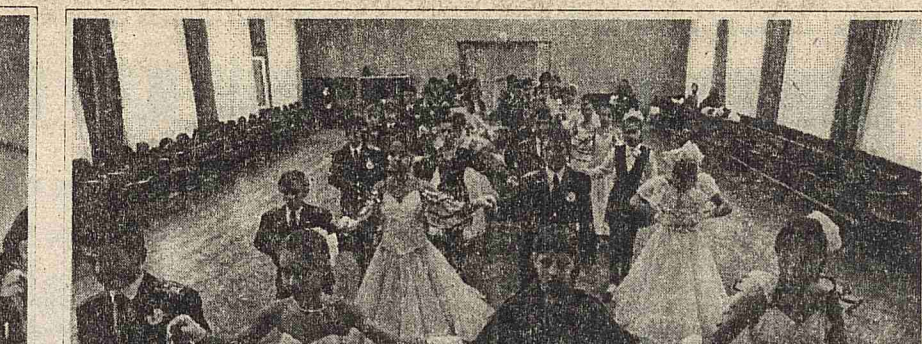
Каждый год рождения отмечает выпуск своего ребенка здоровым, образованным, воспитанным, умеющим жить по законам Российской Федерации...